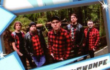
LES RATS D'SWOMPE