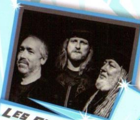
LES FILS DU DIABLE